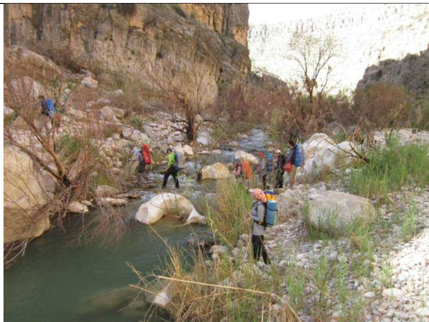
عکس شماره ۵: دره هایقر