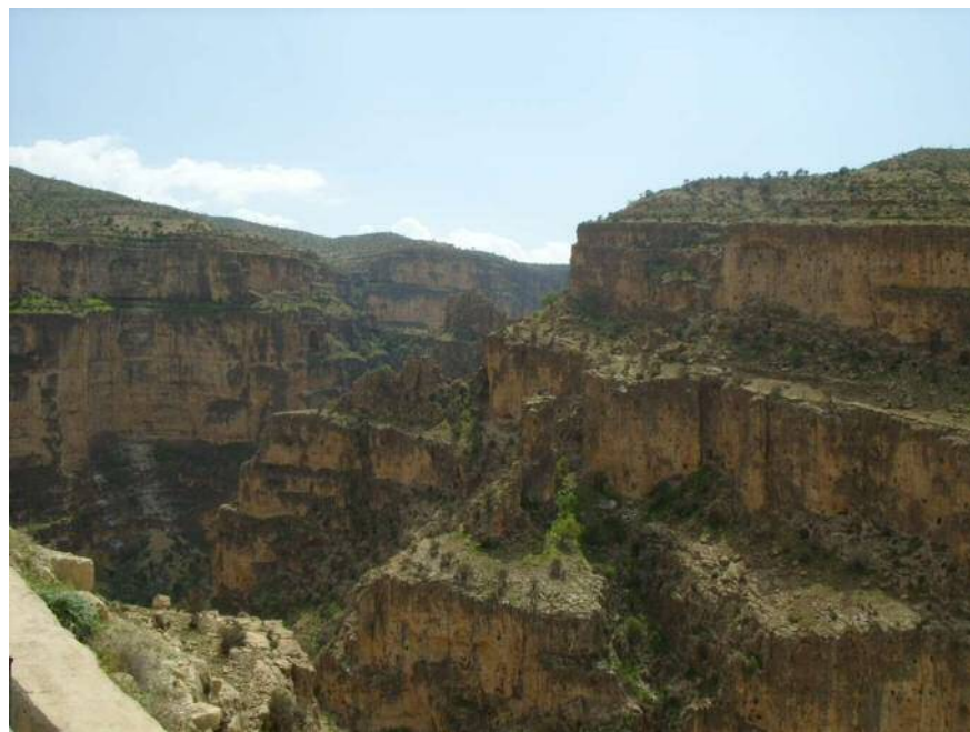
عکس شماره ۲: نمایی از بالای دره هایقر