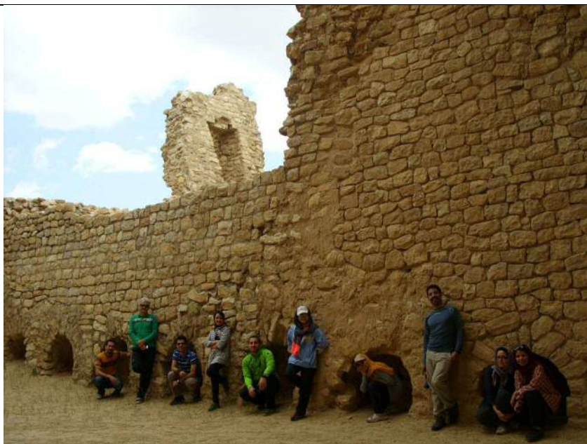
عکس شماره ۱: کاخ اردشیر بابکان