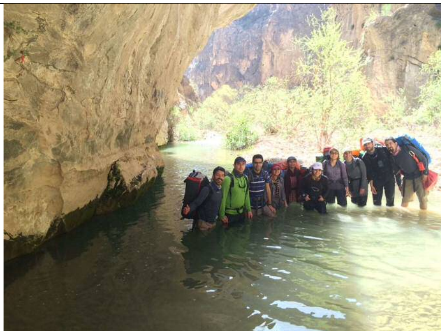
عکس شماره ۳: دره هایقر