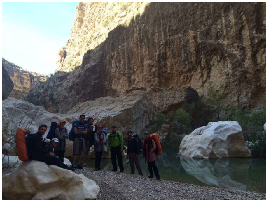
عکس شماره ۶: دره هایقر