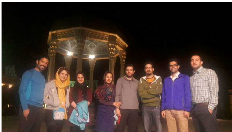
عکس شماره ۸: حافظیه