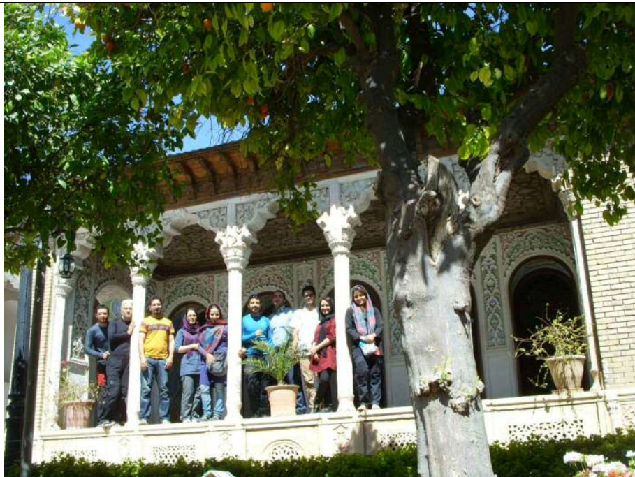
عکس شماره ۷: باغ نارنجستان