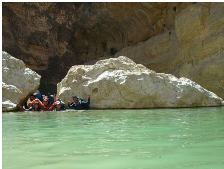
عکس شماره ۴: دره هایقر